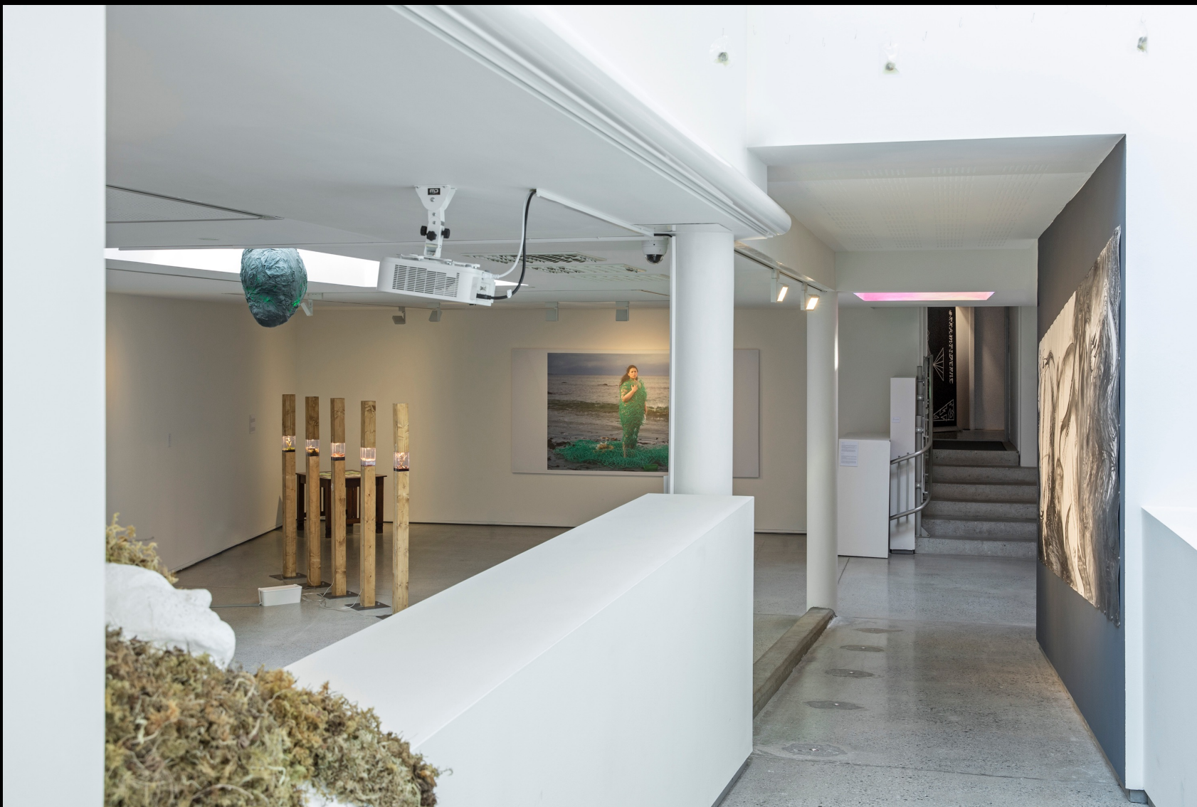
Framtiderne – utstilling 2020.