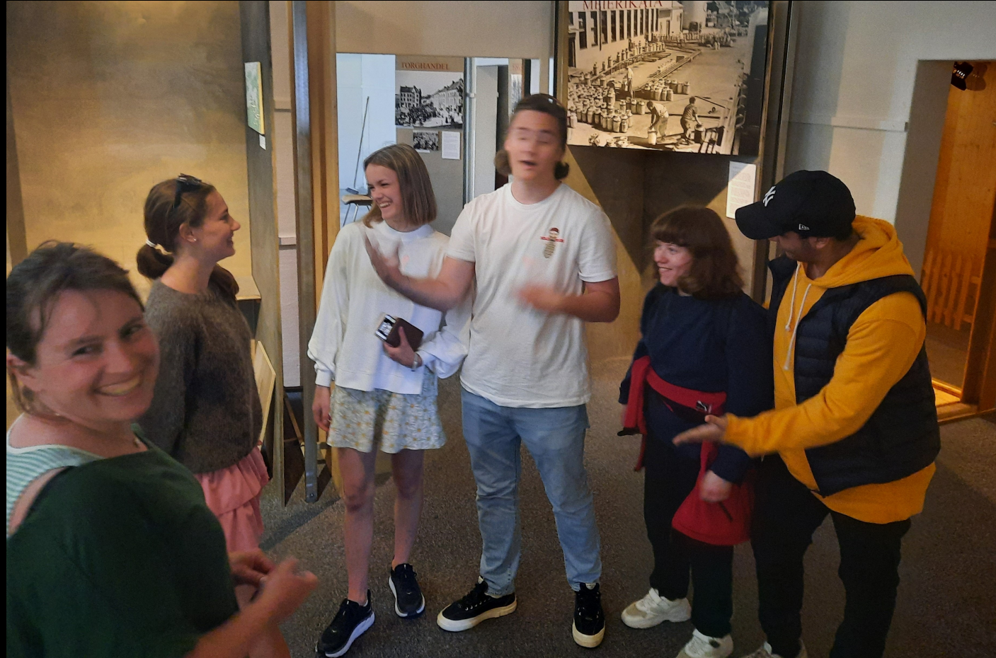
Kloke ungdomar med førstehandskunnskap.