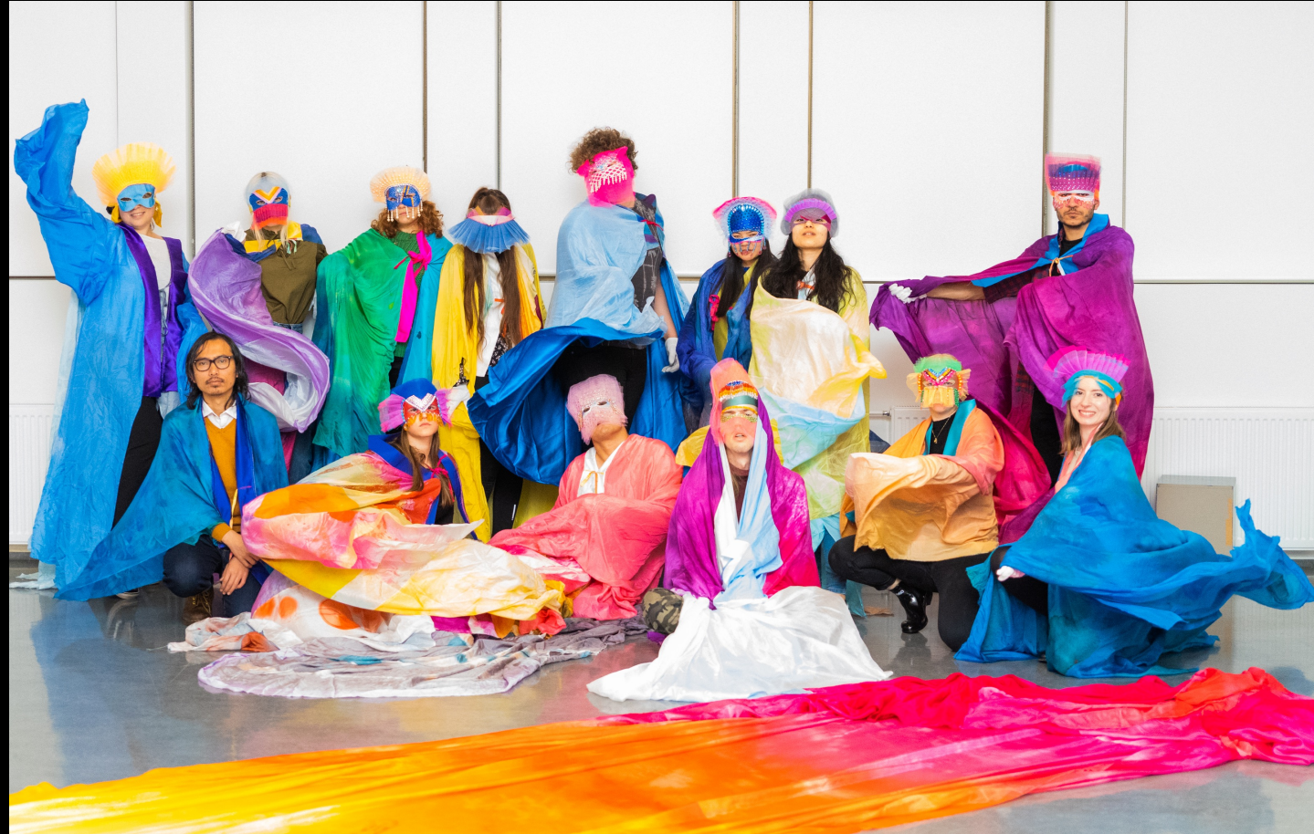
Workshop med Kiyoshi Yamamoto.